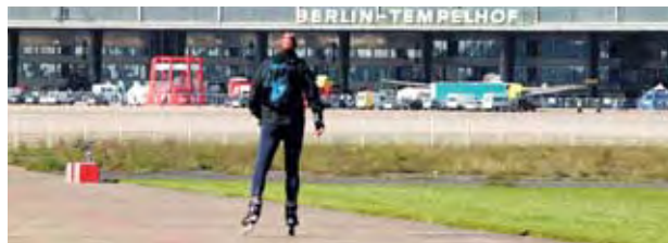
Nach anfänglichen Riesenverlusten ist der ehemalige Flughafen in der Gewinnzone gelandet.

allerdings andere klar kommen. Am 1. April wurde die Flughafenimmoblie an die neu gegründete Tempelhof Projekt GmbH zwecks weiterer Vermarktung übertragen. Wie berichtet, soll die Internationale Gartenbauausstellung auf dem ehemaligen Flugfeld stattfinden. Ansonsten finden Berliner, Touristen, Event-Veranstalter, Mietinteressenten und Investoren, die auf der größten Freifläche der Stadt Aktionen und Projekte realisieren wollen, auf einen Klick alles Wissenswerte und alle Informationen über die Entwicklung unter www.tempelhoferfreiheit.de . HDK